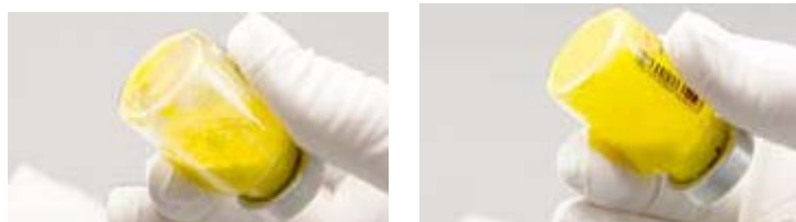
Niet-gesuspenseerd: zichtbare klontjes Gesuspenseerd: geen klontjes