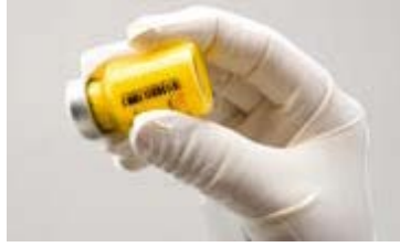
Afbeelding C: Schud de injectieflacon krachtig.

Als er schuimvorming optreedt, laat u de injectieflacon even staan totdat het schuim is verdwenen. Als het product niet direct wordt gebruikt, moet het voor gebruik krachtig worden geschud om het poeder opnieuw te suspenderen. Na reconstitutie blijft ZYPADHERA maximaal 24 uur stabiel in de injectieflacon.