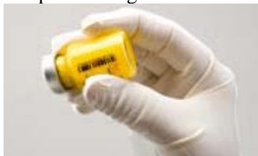
Afbeelding C: Schud de injectieflacon krachtig.

Als er schuimvorming optreedt, laat u de injectieflacon even staan totdat het schuim is verdwenen. Als het product niet direct wordt gebruikt, moet het voor gebruik krachtig worden geschud om het poeder opnieuw te suspenderen. Na reconstitutie blijft ZYPADHERA maximaal 24 uur stabiel in de injectieflacon.