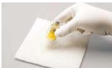
Afbeelding A: Tik krachtig om te mengen.