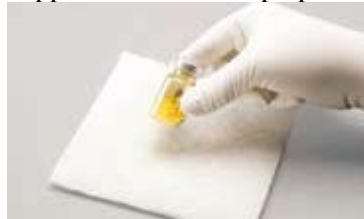
Afbeelding A: Tik krachtig om te mengen.